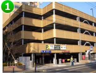
1 駐車場入口です。 駐車券を忘れずにクリニック受付 までお持ちください