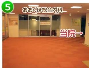
5 降りたところが 医療モールフロアです