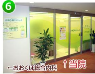
6 「おおくぼ総合内科」の となりが当院です