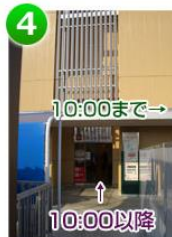
4 「東急ストア」の 裏口に出ます

10:00までの場合 東急ストアが開いて いませんので、右に 建物に沿って進みます