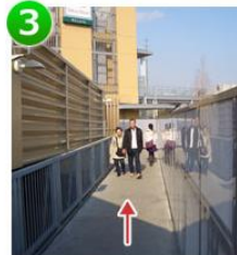
3 渡り廊下をまっすぐ お進みください