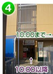
4 「東急ストア」の 裏口に出ます

10:00までの場合 東急ストアが開いて いませんので、右に 建物に沿って進みます