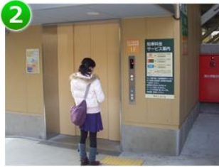
2 駐車場隣接のエレベーターで 「R(屋上)」までお上がりください